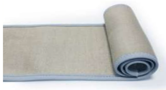
TESSUTO PROTETTIVO PER PREVENIRE E RIDURRE ENTITÀ DI MARCATURE SU LAMIERA PROTECTIVE FABRIC FOR AVOIDING / LIMITING THE ENTITY OF MARKS OF THE SHEET METAL