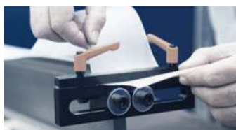
COPPIA DI SUPPORTI PER PELLICOLE / TESSUTI PROTETTIVI COUPLE OF SUPPORT FOR PROTECTIVE SHEET / FABRIC

L = 5 m / 0,4 kg L = 10 m / 0,8 kg Spessore / thickness = Max 6 mm