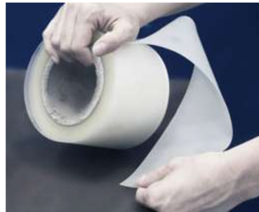
PELLICOLA DI POLIURETANO ANTIGRAFFIO SCRATCH-RESISTANT POLYURETHANE FILM

Las láminas de poliuretano premium de UTILMAQ son láminas de calidad con una alta resistencia y durabilidad, han sido desarrolladas y probadas por las principales marcas de plegadoras del mercado, dejando unos acabados sin marcas en las piezas plegadas, de esta forma se evita una reelaboración y los rechazos de las piezas acabadas (especialmente en el caso de la subcontratación), a la vez que utilizamos la lámina estamos protegiendo las herramientas dándole una vida útil más larga. El uso de las láminas UTILMAQ en las plegadoras son rentables desde el primer uso.